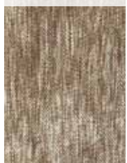
SPACE / IKAT DYEING